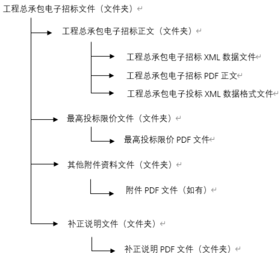
图 3.0.7 补充工程总承包电子招标文件 (文件夹) 的组成

3.0.6 对本市工程总承包电子招标文件 (文件夹) 的组成进行了规定。工程总承包电子招标 XML 数据文件和工程总承包电子投标 XML 数据格式文件应以“附录 A 上海市建设工程总承包电子招标投标 XML 数据文件标准. xsd ”形成的 XML 文件为模板进行编制, 文件格式应符合“附录 A 上海市建设工程总承包电子招标投标 XML 数据文件标准. xsd ”的结构和定义。本条还对本市工程总承包电子招标文件的命名规则进行了规定, 例: 如果招标项目编号为 1501KQ0008QV1, 那么工程总承包电子招标文件名应为 1501KQ0008QV1ZB.QZB, 工程总承包电子招标 XML 数据文件的文件名应为 1501KQ0008QV1ZB.xml, 工程总承包电子招标 PDF 文件的文件名应为 1501KQ0008QV1ZB.pdf, 工程总承包电子投标 XML 数据格式文件的文件名应为 1501KQ0008QV1TBGS.xml, 如果附件 PDF 文件资料为项目总平面图, 那么其文件名应为: 总平面图.pdf; 文件路径应为: 其他附件资料文件\总平面图.pdf。