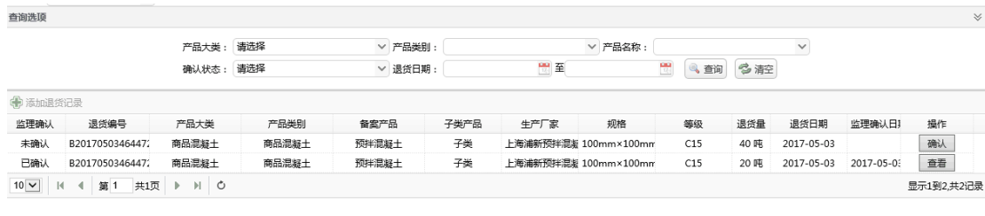
【图 4.6.1】 监理退货确认列表界面