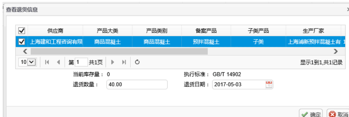
【图 4.6.2】 监理确认界面