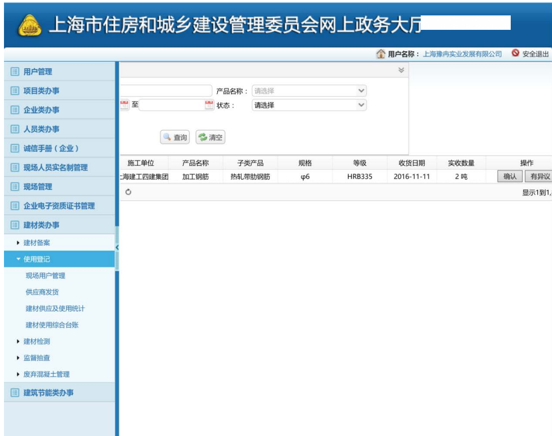
【图 3.2.1】供应商发货查询操作页

1. 页面描述：本页面对产品发货查询以及操作，企业可对收货记录进行发货的确认功能。